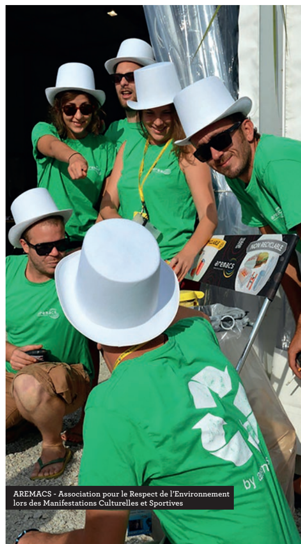
AREMACS - Association pour le Respect de l'Environnement lors des Manifestations Culturelles et Sportives

Cette mission, nous la menons au plus près des entrepreneurs. Nos 2 points d'accueil et nos partenariats avec les autres acteurs de l'entrepreneuriat nous permettent d'être présents dans les territoires ruraux comme dans les quartiers de la Métropole de Lyon.